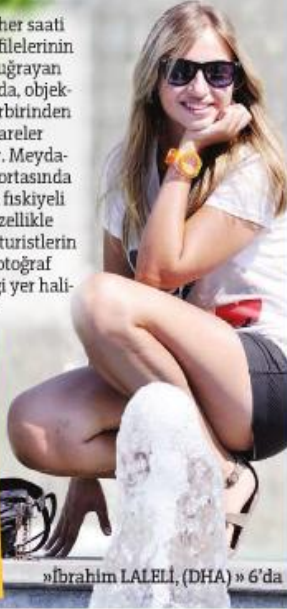
»İbrahim LALELİ, (DHA) » 6'da

■ Günün her saati turist kabilelerinin akınına uğrayan meydanı, objektiflere birbirinden çarpıcı kareler yansıyor. Meydanın tam ortasında bulunan fiskiyeli havuz, özellikle yabancı turistlerin bol bol fotoğraf çektiği yer haline geldi.